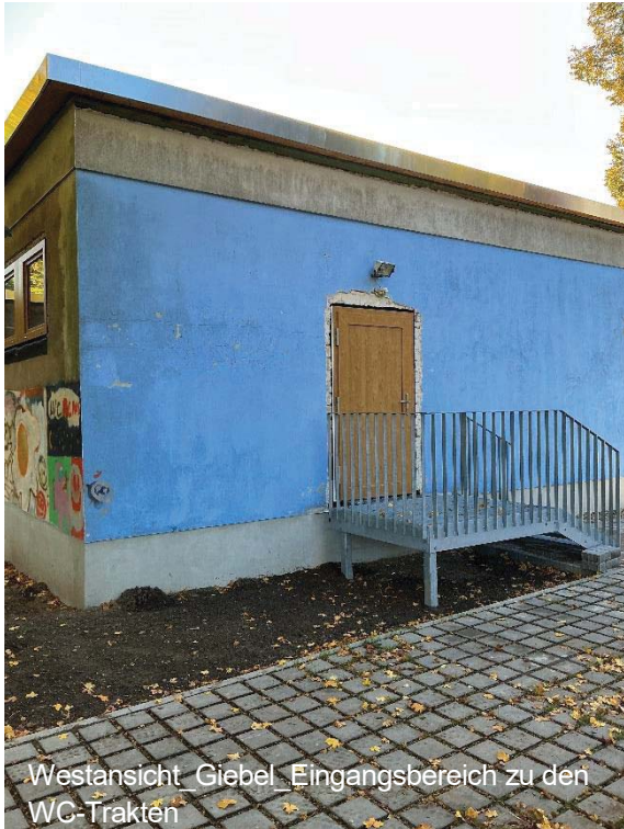
Westansicht Giebel_Eingangsbereich zu den WC-Trakten