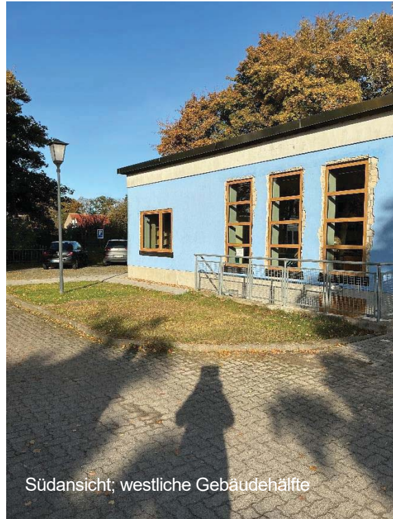
Südansicht; westliche Gebäudehälfte